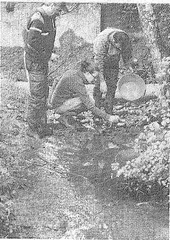
Deux agents de la Fédération ont constaté hier les dégâts les plus apparents.

D'ores et déjà, la Fédération départementale et l'Amicale des pêcheurs de l'Autize - l'AAPPMA de Coulonges-sur-l'Autize y dispose d'un parcours de pêche - se préparent à déposer plainte. Deux agents de la Fédération ont déjà retrouvé une dizaine d'anguilles le ventre en l'air. Mais ce sont des quantités significatives d'anguilles, de carpes, de goujons et de gardons morts qu'ils s'attendent à récupérer dans le fond du lit du Fenioux. Ce cours d'eau de 1 re catégorie